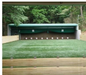
東松山キャンパス弓道場