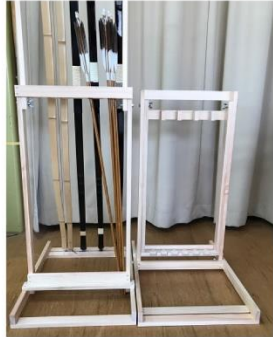
式立て弓立 木製 折り畳み式 軽量(いわお)