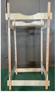
式立て弓立 組み台(く) 組楽新案申請中 単巻(実用)